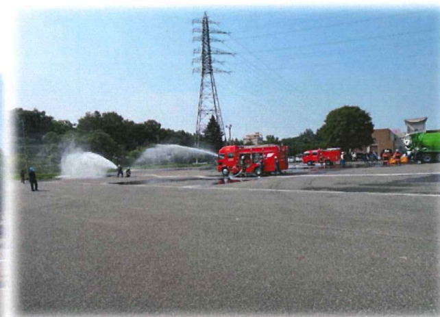
消火用水 放水開始