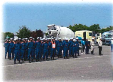
音更町消防署 隊員 団員